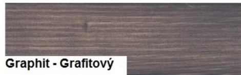
Graphit - Grafitový