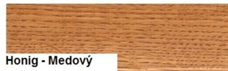
Honig - Medový