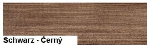
Schwarz - Černý