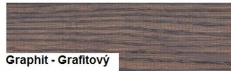
Graphit - Grafitový