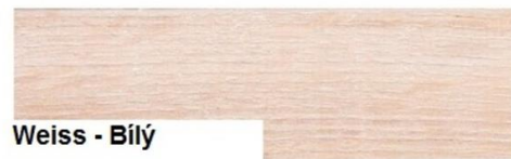
Weiss - Bílý