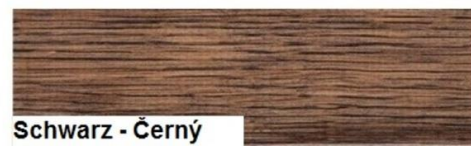
Schwarz - Černý

Naše technické poradenství slovem i písmen vychází z dlouholetých zkušeností, trvalých ověřovacích zkoušek a nejnovějšího stavu poznatků, přesto je lze považovat pouze za nezávazná doporučení. Veškeré přípravné práce a následné nátěrové vrstvy musí být upraveny a navrženy po důkladném posouzení objektu a musí odpovídat stavu a požadavkům objektu, na kterém má být nátěr použit. Technologie úpravy a ošetření dřevěných povrchů vychází z obecně uznávaných zákonitostí funkce „dřevo + nátěrová hmota“. Vhodnost nátěrového systému, zpracování a nanášení námi dodávaných produktů leží mimo naše kontrolní možnosti a jsou tedy plně v kompetenci spotřebitele. Ručíme samozřejmě za neměnnou kvalitu našich produktů. Vystavením nového Technického listu se ruší platnost všech předchozích. Datum vydání: červenec 2016