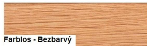
Farblois - Bezbarvý