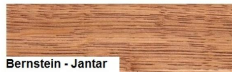
Bernstein - Jantar