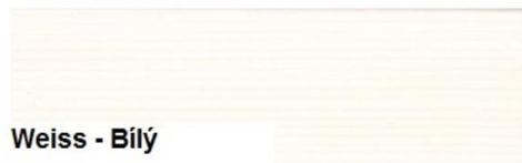
Weiss - Bílý