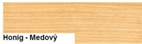
Honig - Medový